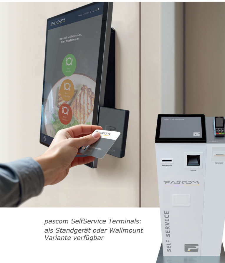
pascom SelfService Terminals: als Standgerät oder Wallmount Variante verfügbar

Zusätzlich bietet das SelfService Terminal eine praktische Übersicht über alle Buchungen.