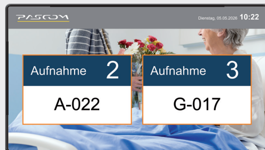
Aufrufscreen mit Unterhaltungsprogramm

Auch das Personal wird deutlich entlastet, da das zeitaufwendige Suchen von Patienten entfällt.