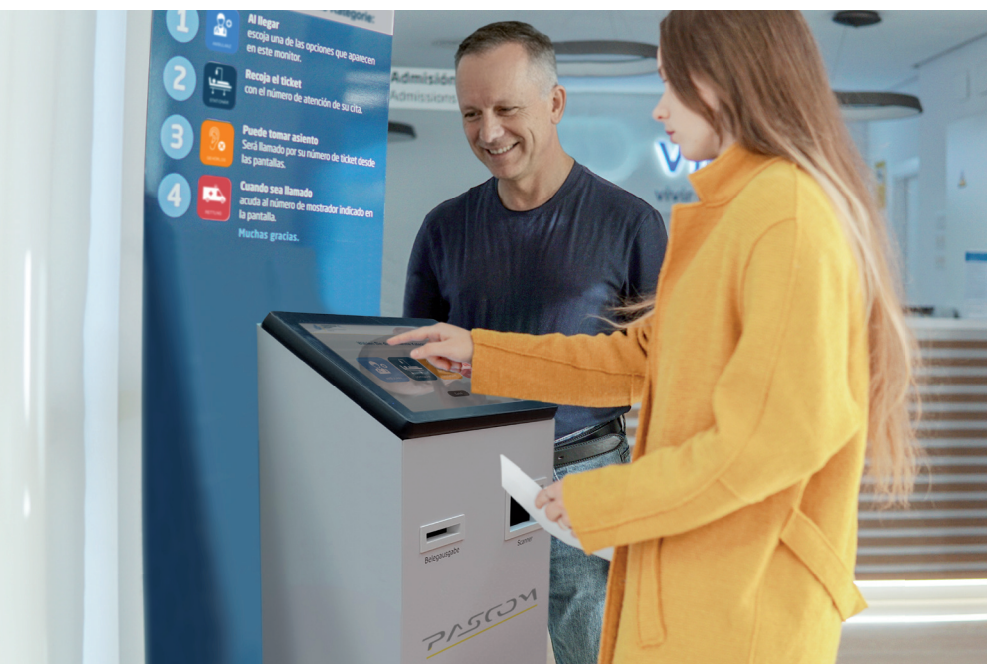
Anmelden am pascom SelfService Terminal