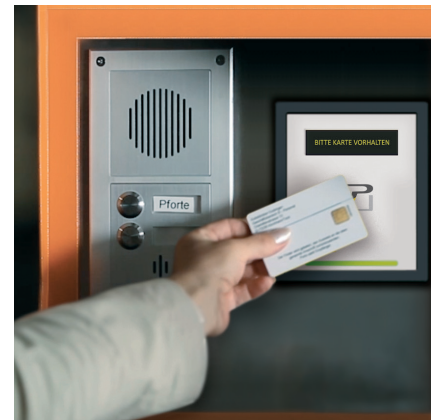
Einfahrt in den Parkraum