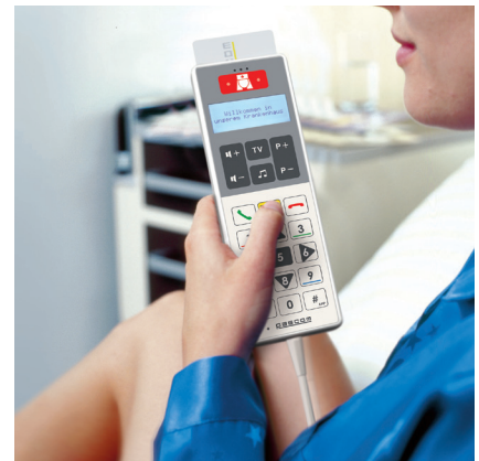
Abrechnung mit pascom MediaBox

lichen Anwendungsfälle frei definierbare Tarif- und Verrechnungsmodelle (Vor- oder Nachinkasso). Sie erhalten größtmögliche Flexibilität und völlige Transparenz über jeden Zahlvorgang!