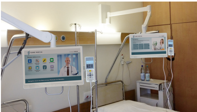
SMART TV für bettenweises Fernsehen, Wandschwenkarm

Die zentrale Verwaltung der SMART-Infos und Info-Apps erfolgt im Content Management System. Auch allgemeine TV-Settings wie z.B. Senderlisten oder Lautstärkenbegrenzung können zentral geändert werden, ohne das jeweilige Zimmer betreten zu müssen. Dies spart Zeit und stellt sicher, dass Ihre Patienten im Zimmer nicht gestört werden.