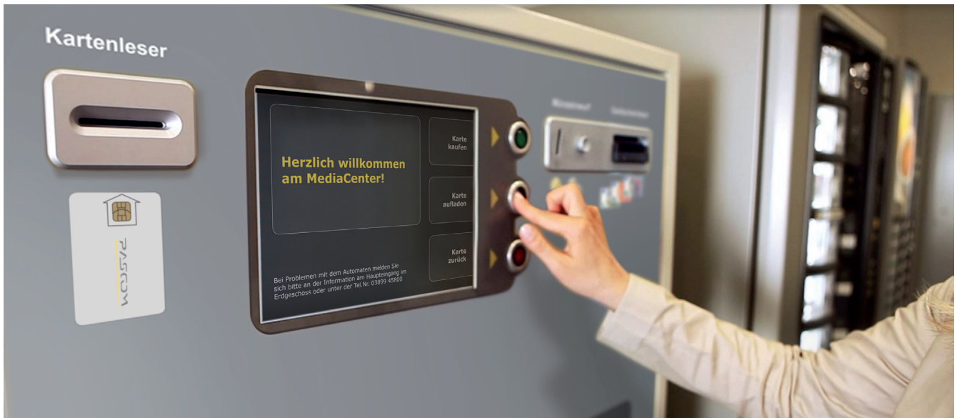
Aufladen am pascom MediaCenter

Der Aufladevorgang kann sehr bequem an dafür vorgesehenen pascom Kassenautomaten, über die Gehaltsabrechnung oder in Kombination durchgeführt werden. Die elektronische Geldbörse bietet für die unterschied-