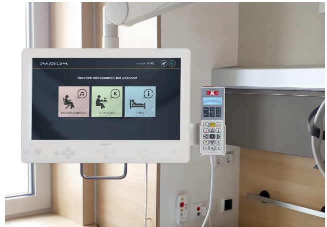
SMART TV am Nachttisch-Schwenkarm

Aber auch zimmerweises Fernsehen ist mit pascom SMART TV purer Komfort, da der geschlossene Ton auf die pascom MediaBox an jedem Bett übertragen wird. So ist die notwendige Ruhe im Mehrbettzimmer gewährleistet.