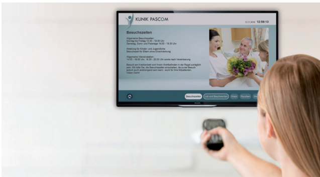
pascom SMART TV auch als zimmerweise Lösung