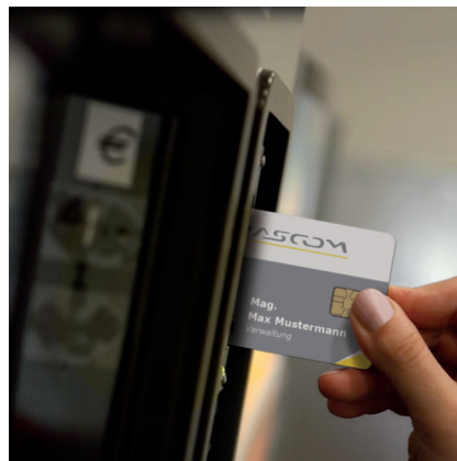
Bezahlen am Automaten