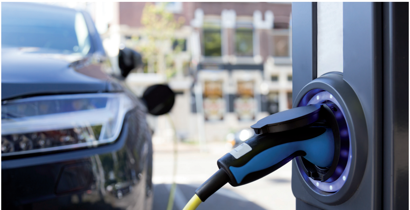
Bezahlen an der e-Ladestation