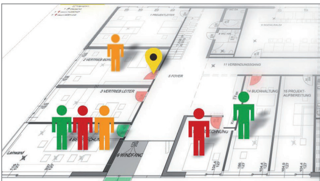
Visualisierung des Zutrittsystems

Organisatorische Prozesse adressieren ein zentrales, automatisiertes Berechtigungsmanagement, indem Zutrittsberechtigungen für Personen anhand