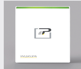
Farbvariante Weiß Art.-Nr. XS-O2.R00001K100

Der pascom XS.Reader ermöglicht in Kombination mit dem XS.net/io Türsteuermodul/-Controller die gesicherte Zutrittskontrolle zu den Räumlichkeiten.