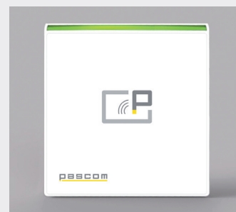
Farbvariante Weiß Art.-Nr. XS-O2.R00001K100

Der pascom XS.Reader ermöglicht in Kombination mit dem XS.net/io Türsteuermodul/-Controller die gesicherte Zutrittskontrolle zu den Räumlichkeiten.