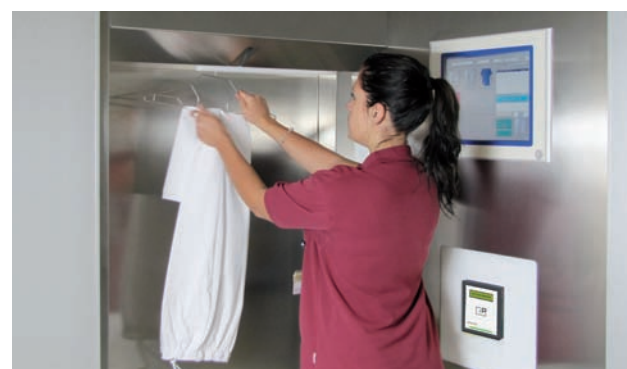
pascom XS.Reader am Wäscheausgabe-Automaten